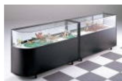
カウンターケース